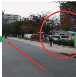
8) 右手に駐車場がみえれば もうすぐです