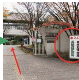
9) 門から中へお入りください