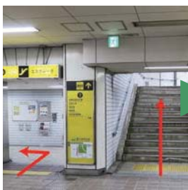
1) 御堂筋線「長居」駅3号出口