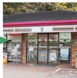
4) 右手にセブンイレブンが あります