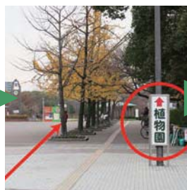
3) 「植物園」の看板の方向へ、 まっすぐ進む