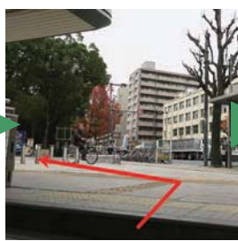
2) 3号出口を背に左へ