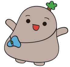
長居植物園キャラクター しょくぼん